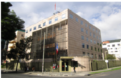
Ambaixada francesa a Bogotà