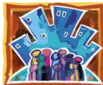
Ciutats defensores dels drets humans

Completar aquestes polítiques, amb un projecte de promoció i sensibilització dóna sentit a tota l'acció de govern dels consistoris implicats en el projecte i és la seva principal justificació.