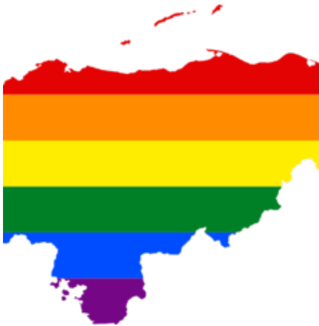
Mapa LGTB d'Hondures, licència pública Wikimedia