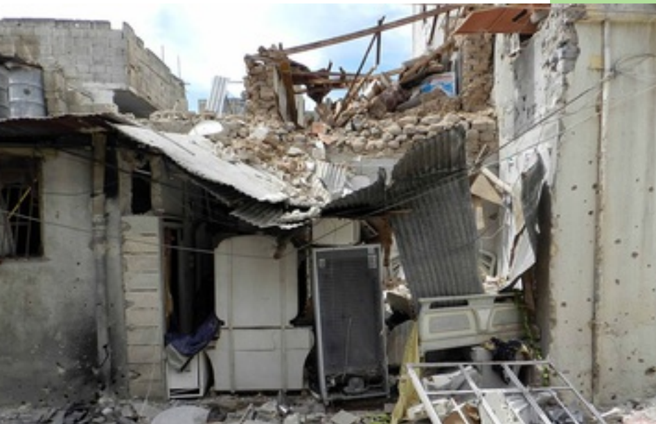
Destrució a Bab Dreeb, Homs, Síria

Per tot això, recordem les exhortacions de la CCAR a la Comunitat Internacional, la UE i l'estat Espanyol sobre visats de trànsit, reassentament i el reglament de Dublín aquí: http://www.ccar.cat/siria-despres-de-tres-anys-de-conflicte-la-ccar-alca-la-veu-i-llanca-propostes-per-a-les-persones-refugiades/